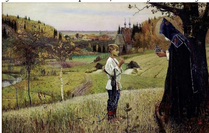
М.В. Нестеров, Видение отроку Варфоломею, 1889-1890

найти пропавших жеребцов. Когда он пришел в поле, ему привиделось: перед ним стоял старец в монашеском одеянии. Тот спросил мальчика о мечте. И тогда Варфоломей сообщил о желании обучиться грамоте, которая ему никак не дается. Старец, выслушав его, протянул маленький ковчежец с просфорой и пообещал, что мечта исполнится. Так и случилось. А повзрослев, стал служить Богу.