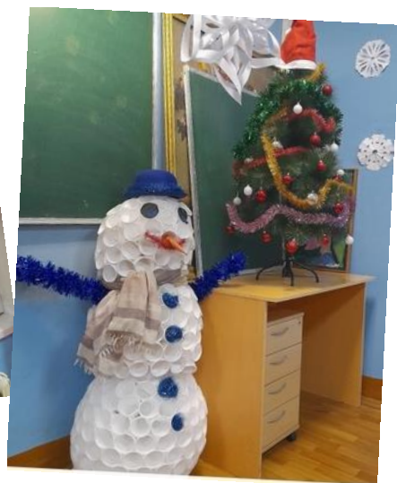
Фото победителей школьного конкурса новогодних украшений «Самый новогодний класс»